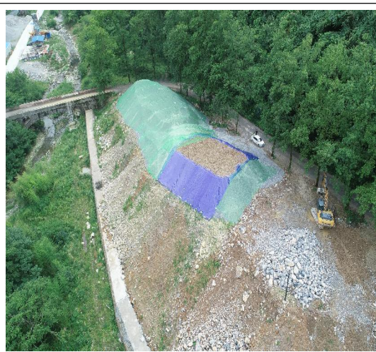
K17+500 弃渣场 (需及时进行修建截水沟)