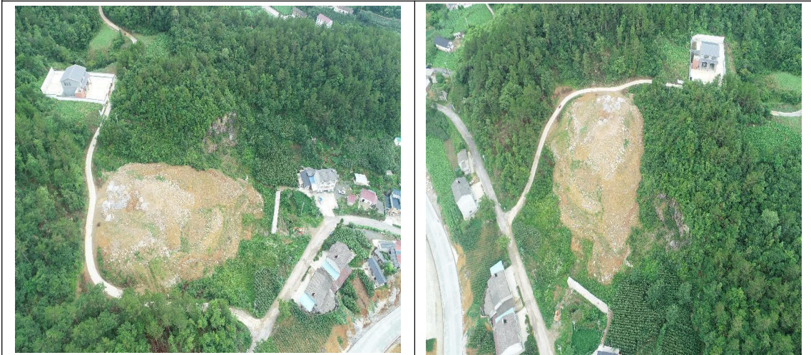
K21+920 弃渣场 (需及时进行土地整治、修建截水沟)