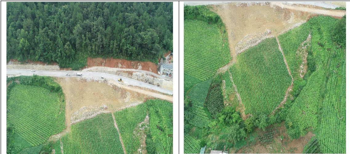
K21+580 弃渣场 (需及时进行修建截水沟)