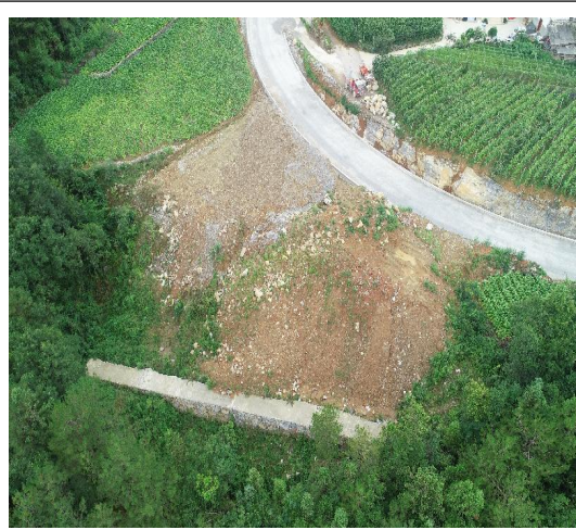
K21+080 弃渣场 (需及时进行修建截水沟、进行植被恢复)