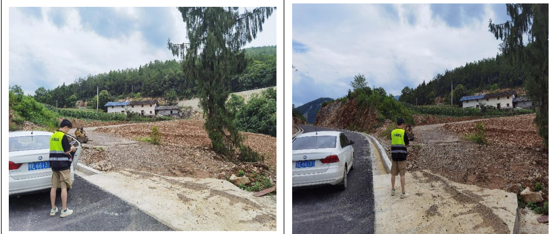
本期水土保持工作