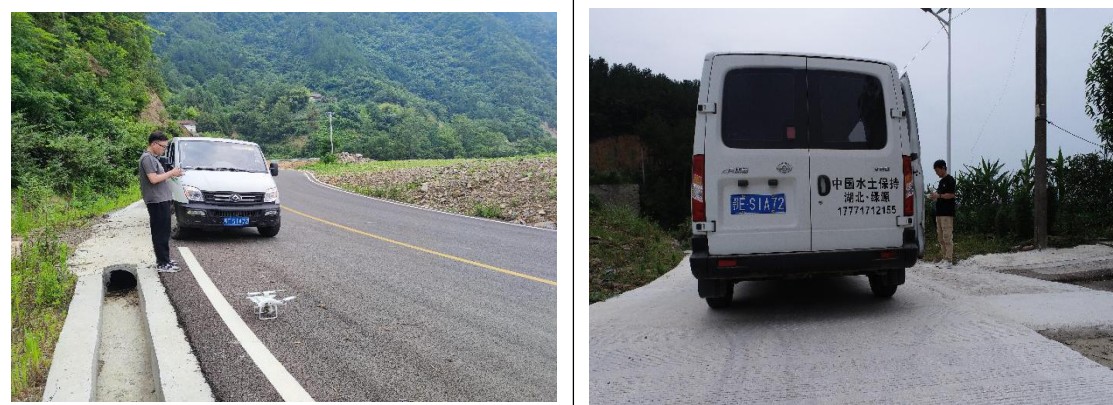
本期水土保持监测，无人机航拍