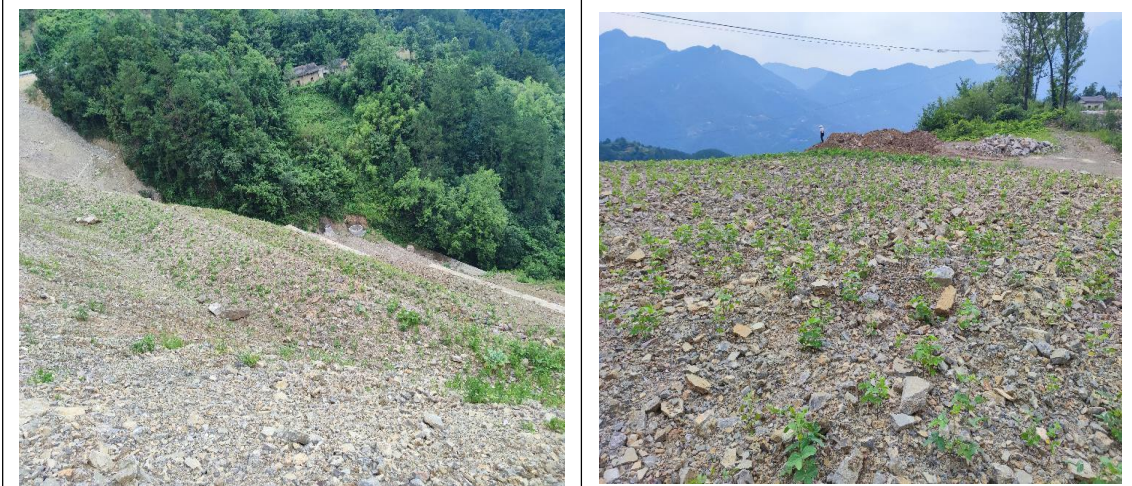
弃渣场分级放坡+复耕绿化