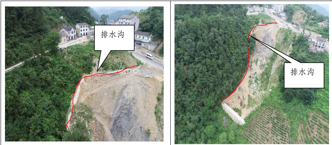
K12+180 弃渣场 (本季度完善排水沟, 还需完善坡面植物措施)