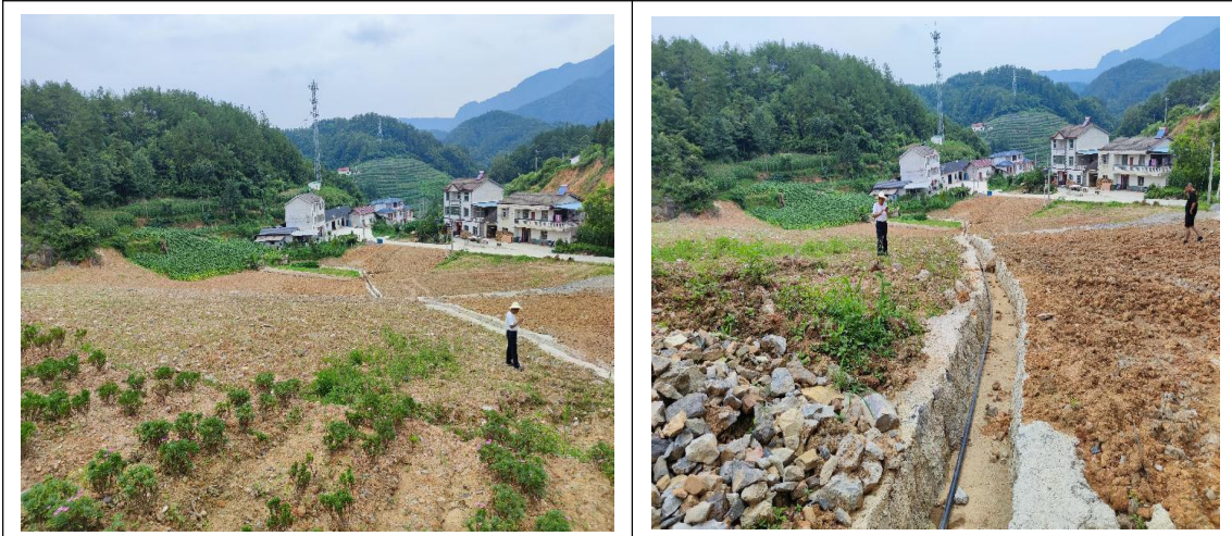
弃渣场排水沟+复耕绿化