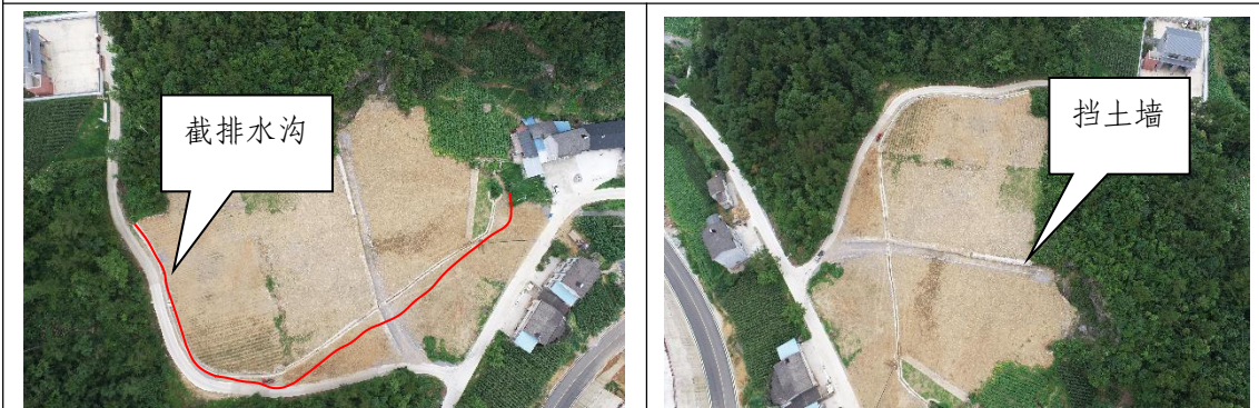
K21+920 弃渣场（本季度新增分级放坡、截排水沟、挡土墙、复耕措施完善）