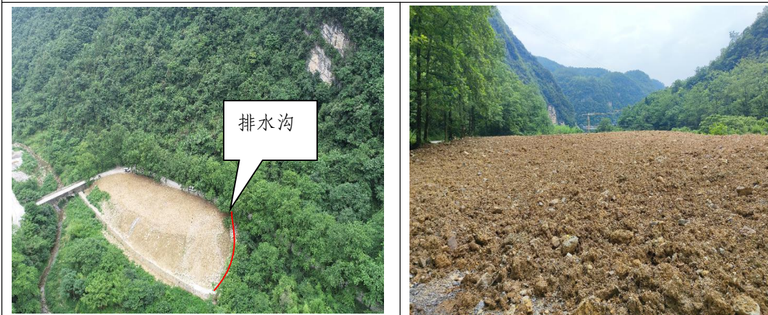
K17+500 弃渣场 (及时完善植物措施)