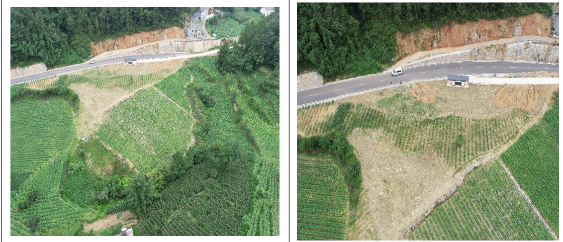
K21+580 弃渣场（已进行复耕）