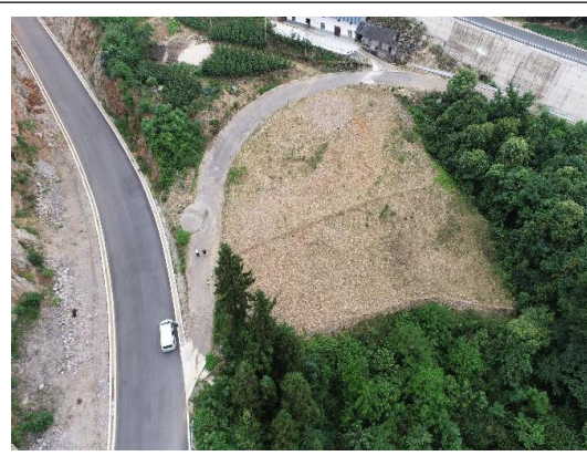
K2+281 弃渣场（已进行土地整治）