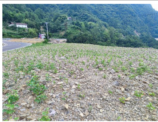
K10+140 弃渣场（已进行土地整治并复耕，还需完善排水措施）