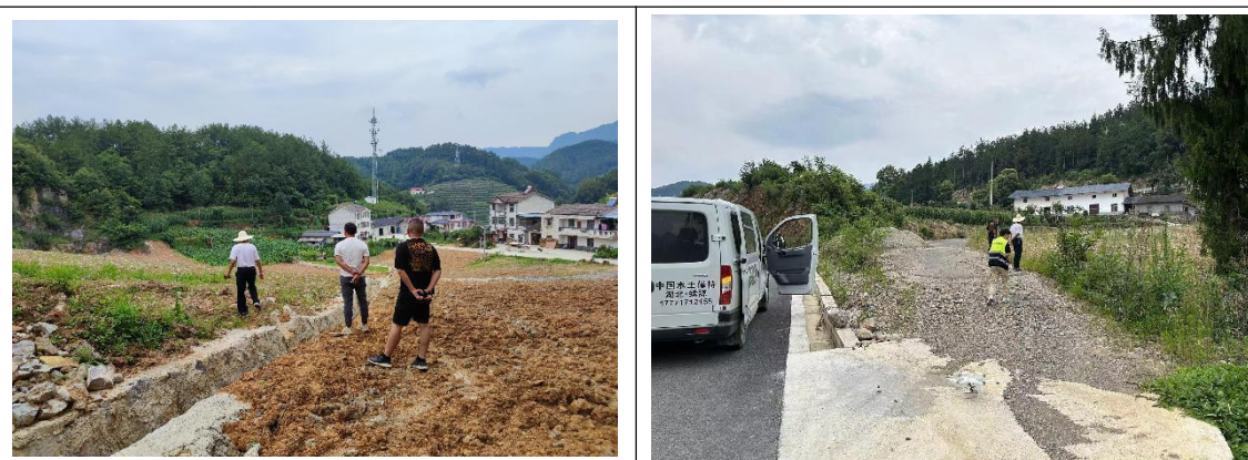
本期水土保持监测，弃渣场复核

(3) 根据收集整理的水土保持相关资料与建设单位、监理单位、施工单位进行对接，针对现场问题进行协商处理。