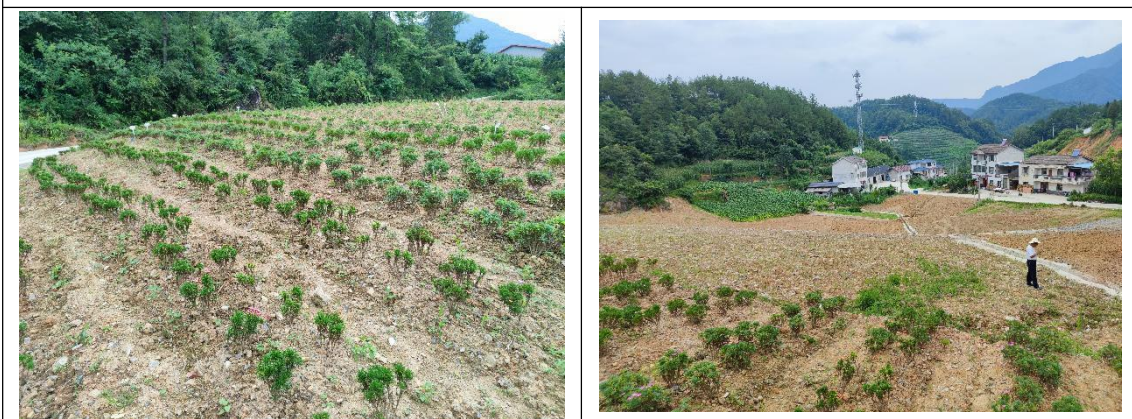
表土回覆、绿化整地