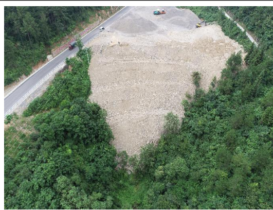
K4+840 弃渣场（弃渣场已分级放坡，及时清理碎石，需完善植物措施）