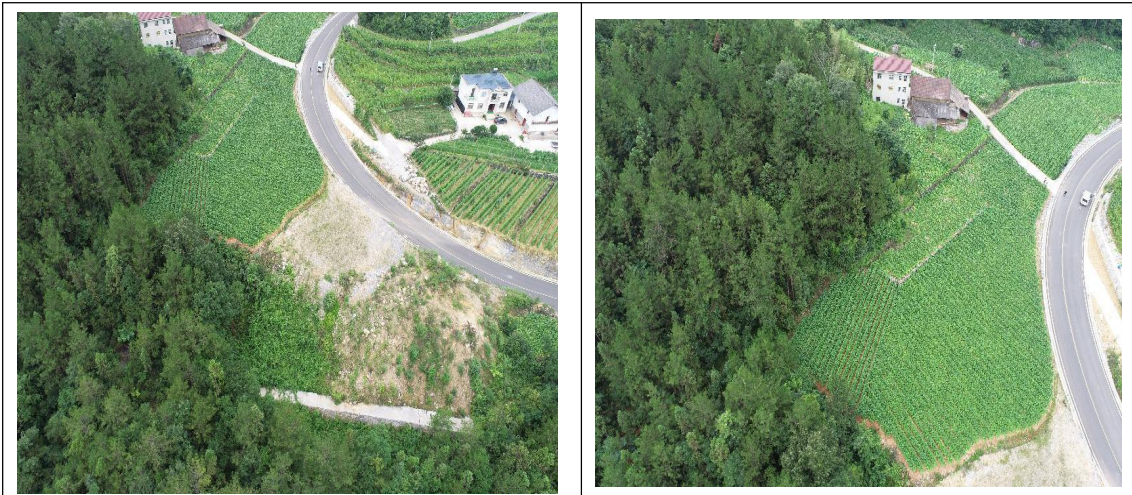
K21+080 弃渣场（对未复耕的及时进行完善）