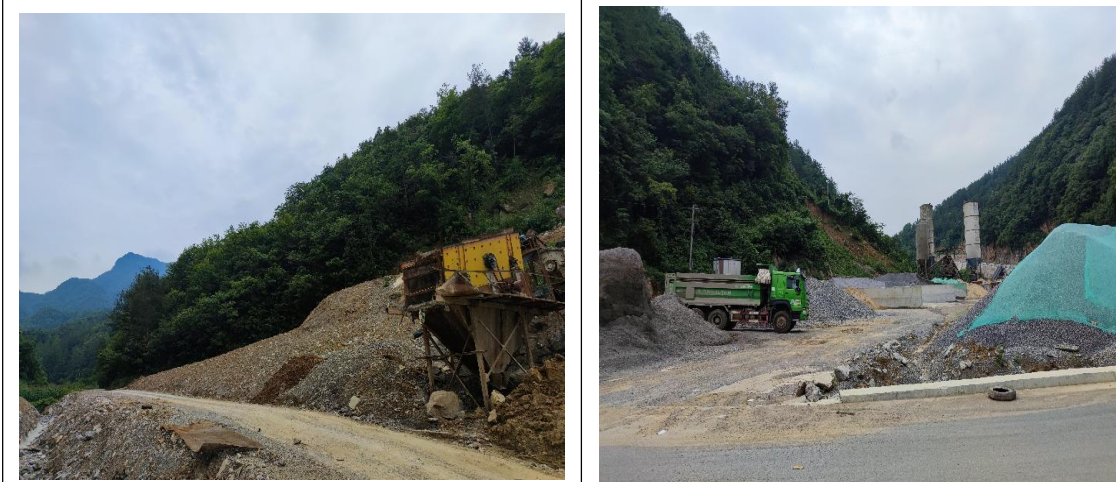
K20+050 弃渣场 (及时完善植物措施)