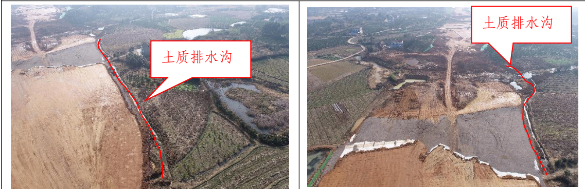
道路两侧土质排水沟