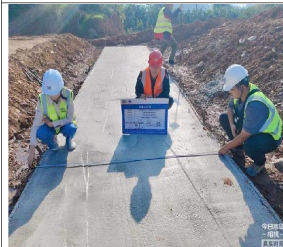
K14+473 排水箱涵基础垫层 (2023.10.29)