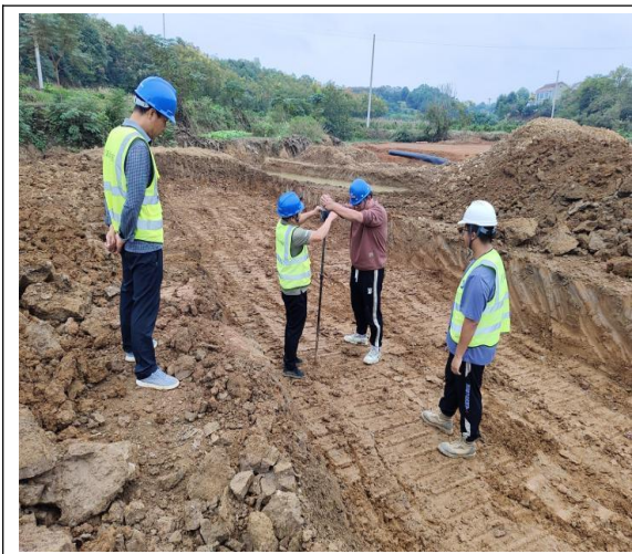
k15+240 排水箱涵沟槽承载力检测 (2023.09.29)