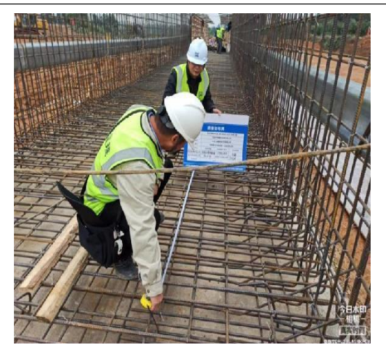
K17+646 排水箱涵钢筋 (2023.11.15)