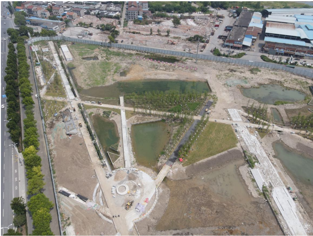
城市活力公园区现状（2023年9月）