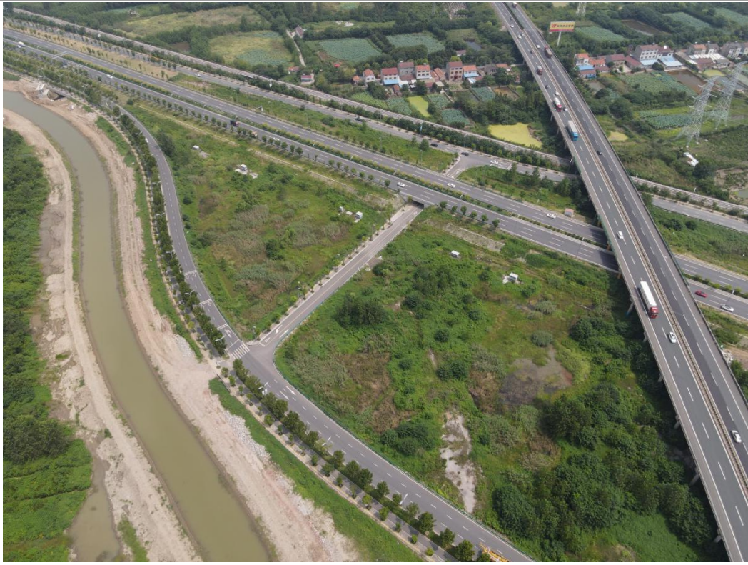
运动及水岸公园区现状（2023年9月）