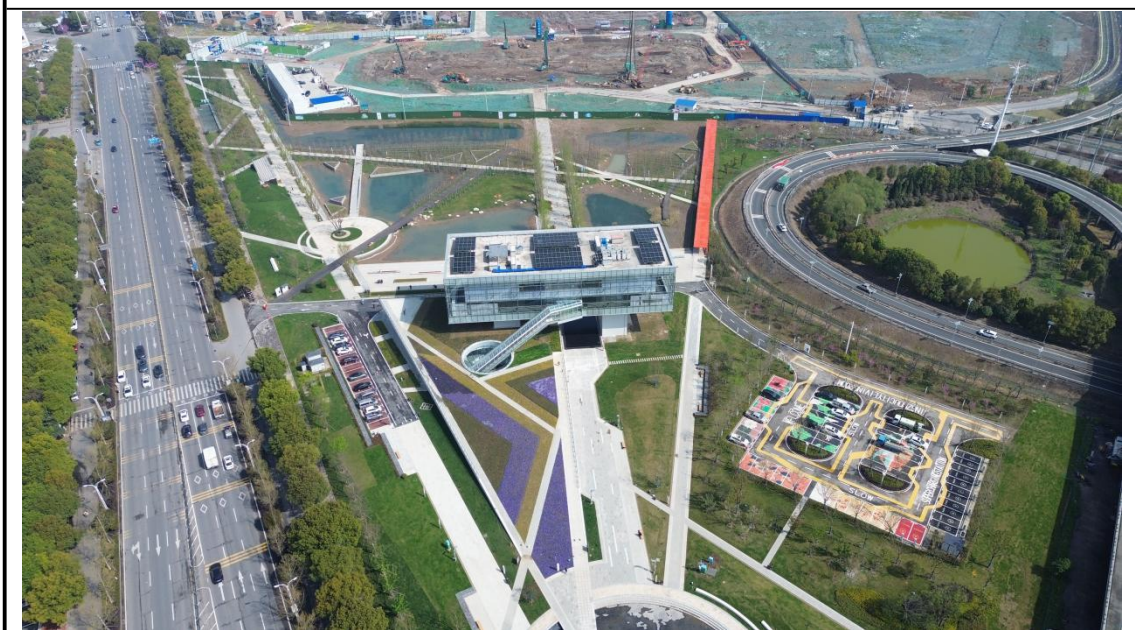
城市活力公园区现状（2024年3月）