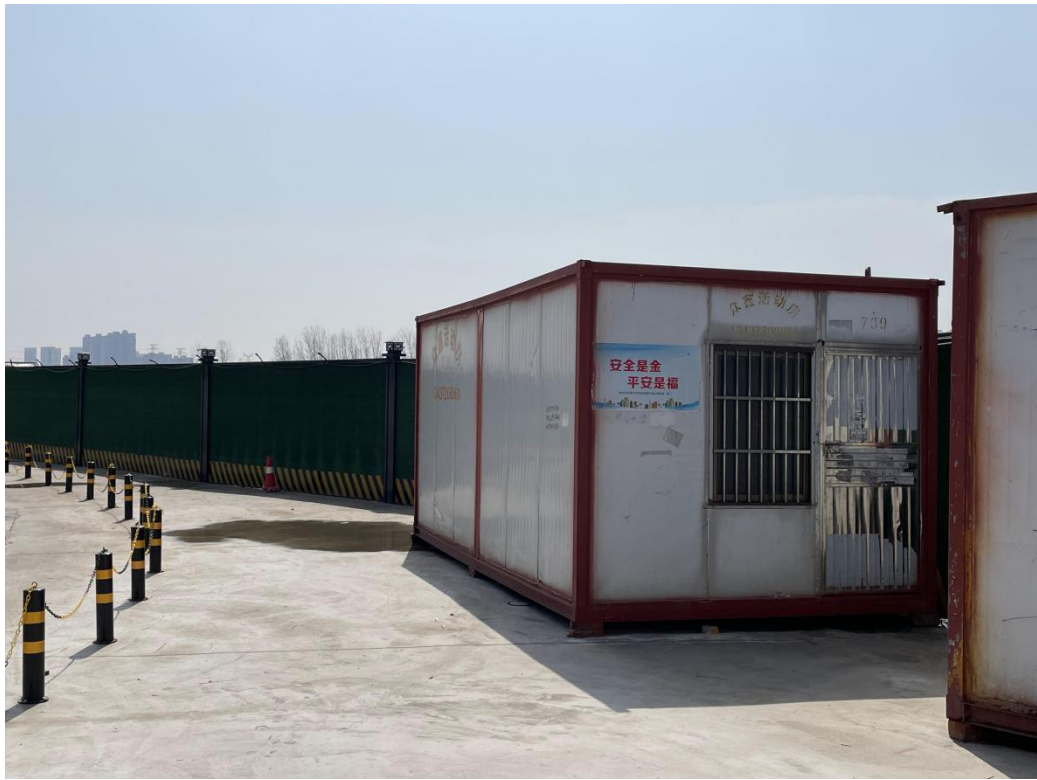
施工生产生活区（2024年3月）