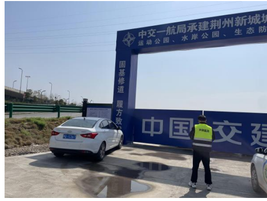
水土保持现场监测