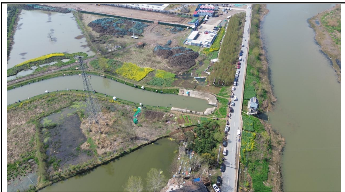
运动及水岸公园区现状（2024年3月）