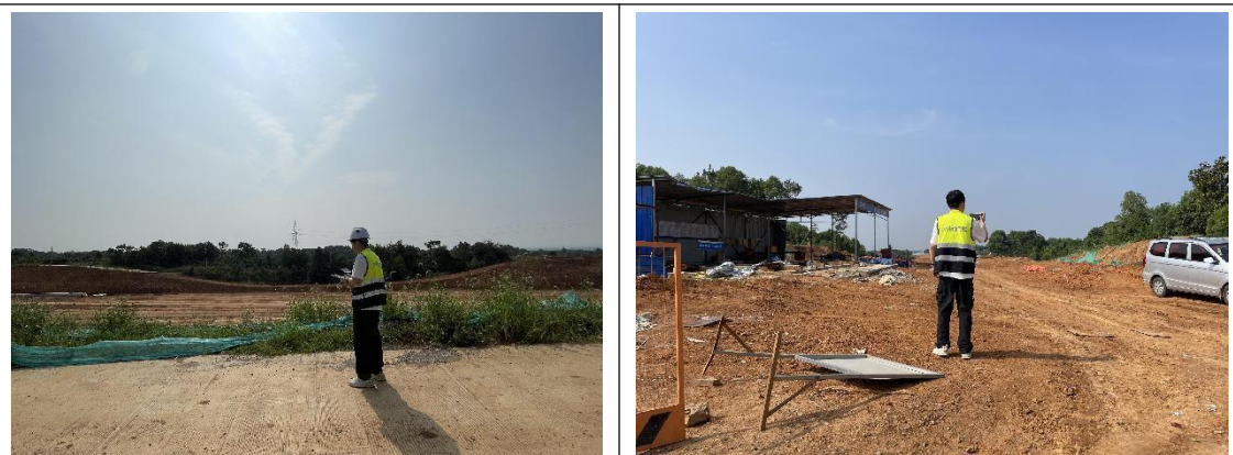
本期水土保持监测，无人机航拍