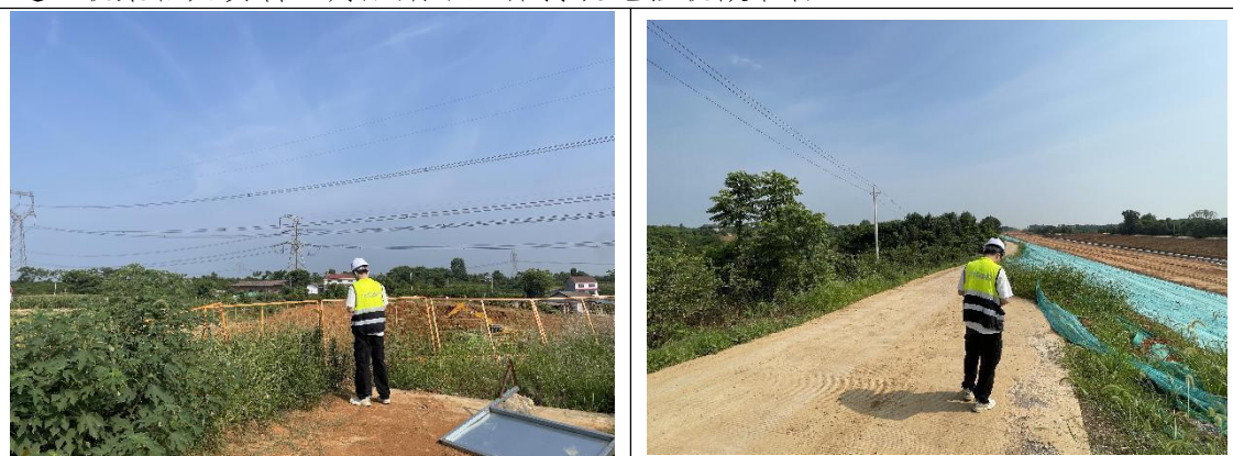
本期水土保持监测，无人机航拍

(4) 针对现场问题出具水土保持监测意见书，并针对现场整改措施进行沟通。收集相关资料，为后期水土保持设施验收做准备。