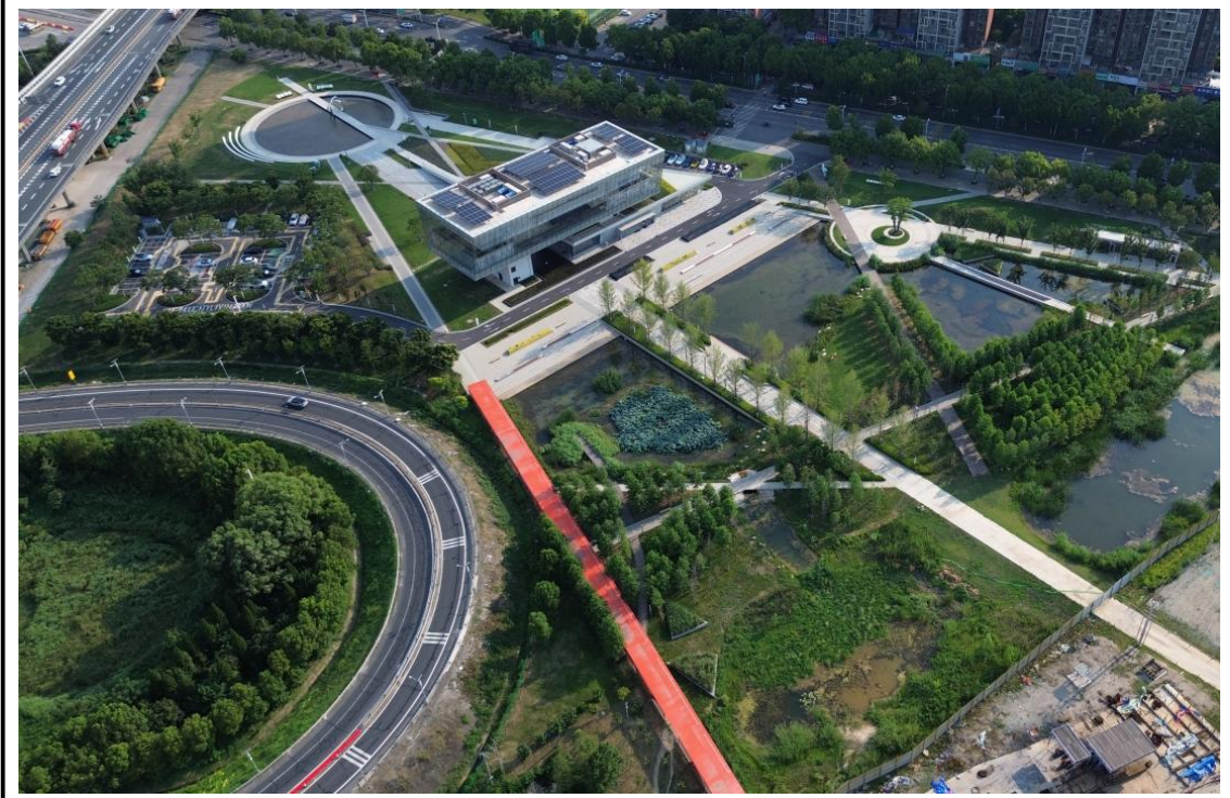
城市活力公园区现状（2025年9月）