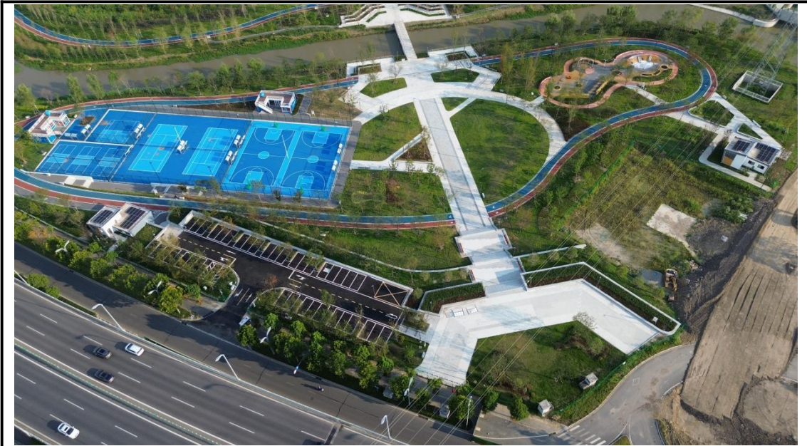
运动及水岸公园区现状（2025年9月）