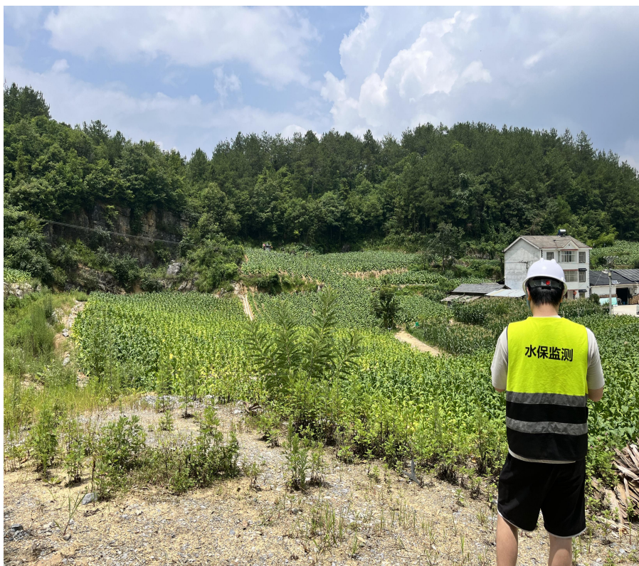
本期水土保持监测

(2) 复核弃渣场措施实施情况，针对上季度向建设单位提出的水土保持意见，查看现场整改情况，对现场整改情况进行调查，并将整改情况反馈至建设单位。