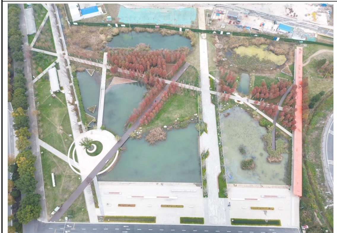
城市活力公园区现状（2025年12月）