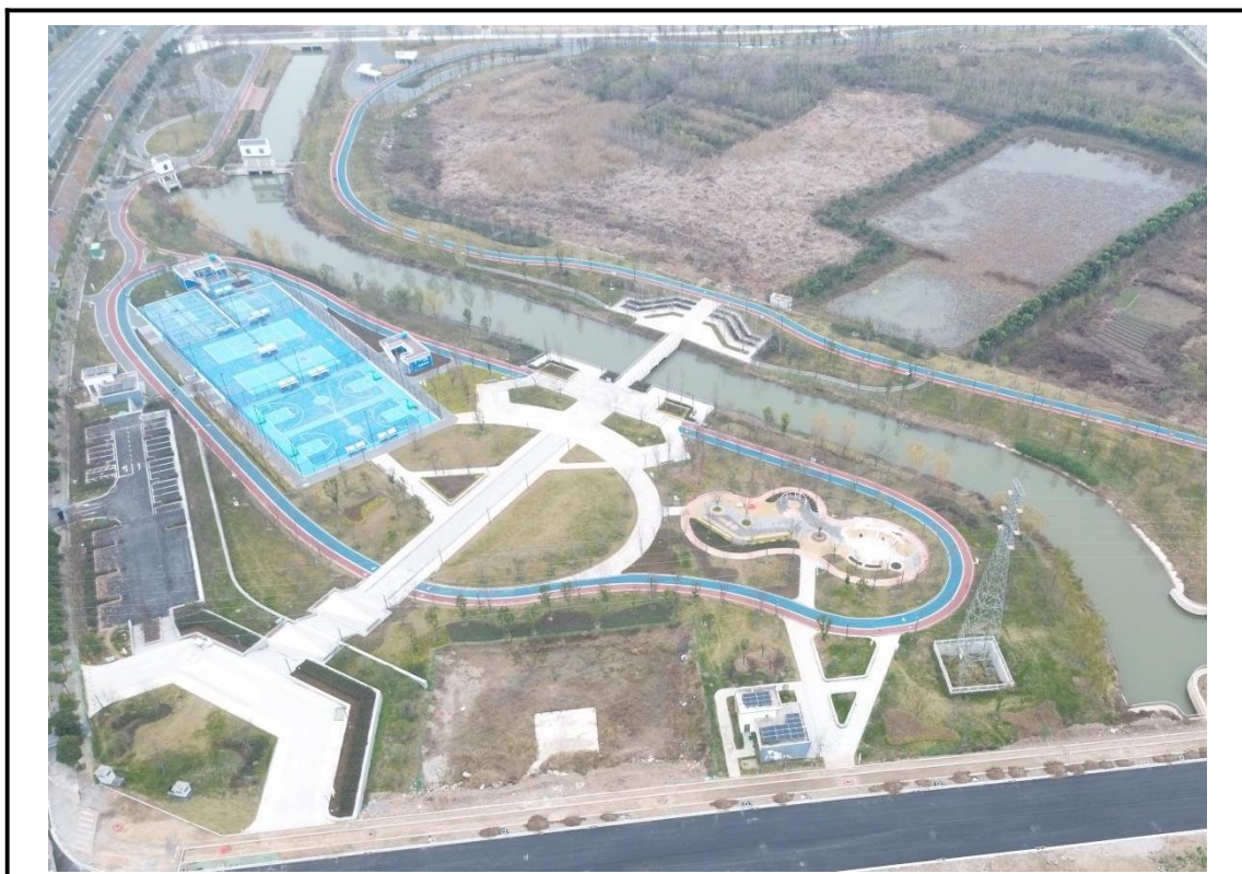
运动及水岸公园区现状（2025年12月）