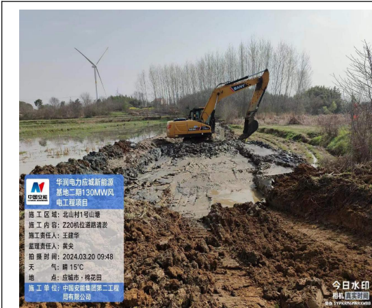
Z20 道路开挖回填 (2024.03.20)