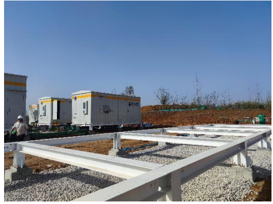
升压站及储能电站施工现场