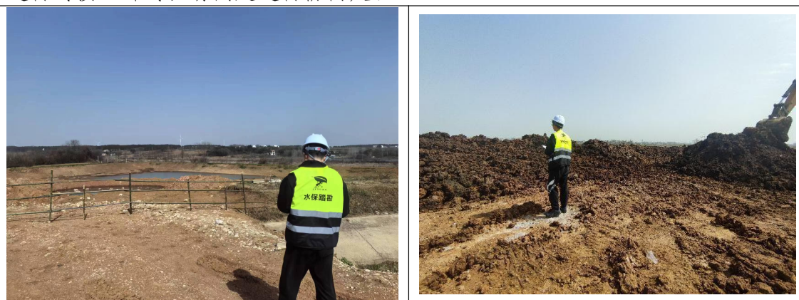
本期水土保持监测，无人机航拍

(3) 根据收集整理的水土保持相关资料与建设单位、监理单位、施工单位进行对接，针对现场问题进行协商处理。