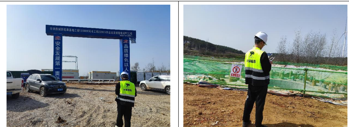
本期水土保持监测，无人机航拍