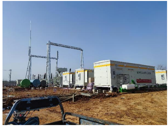
升压站及储能电站施工现场