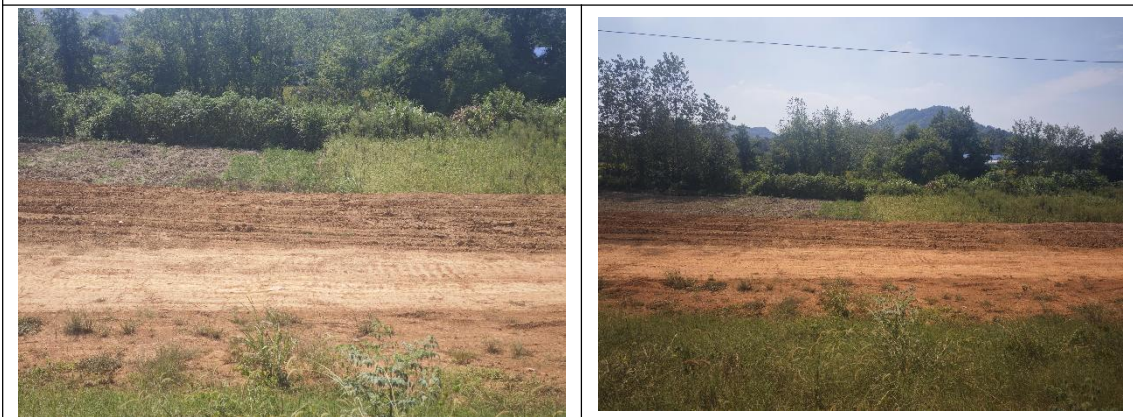
压浸平台需及时进行撒播草籽