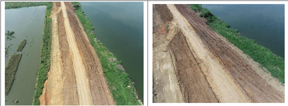
四 2+200~四 2+600 段