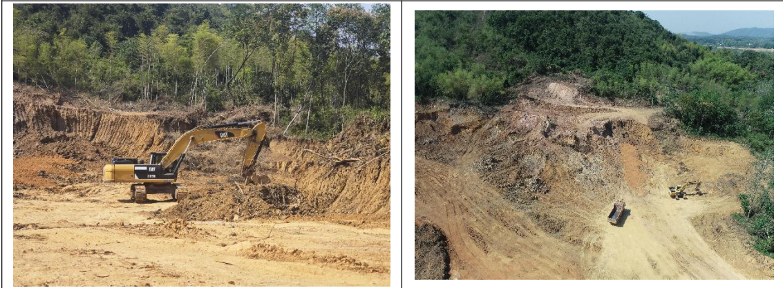
四清 2 号取土场