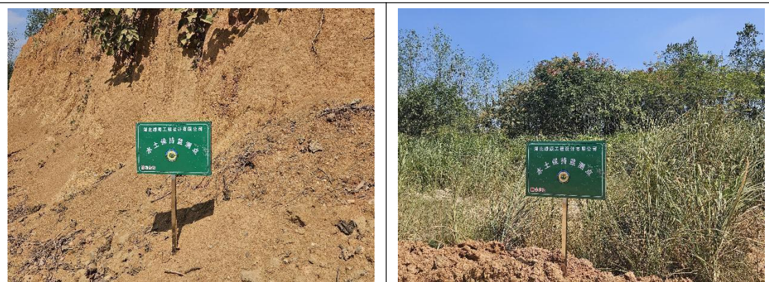
水土保持监测点位