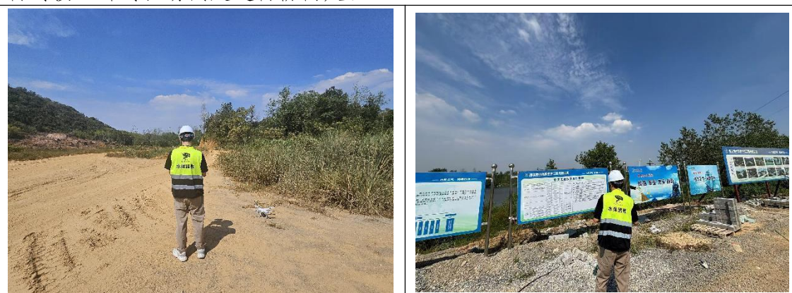
本期水土保持监测，无人机航拍

3、根据收集整理的水土保持相关资料与建设单位、监理单位、施工单位进行对接，针对现场问题进行协商处理。