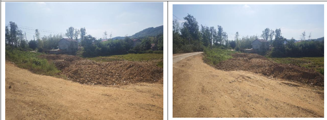
临时堆土场需及时补充苫盖措施