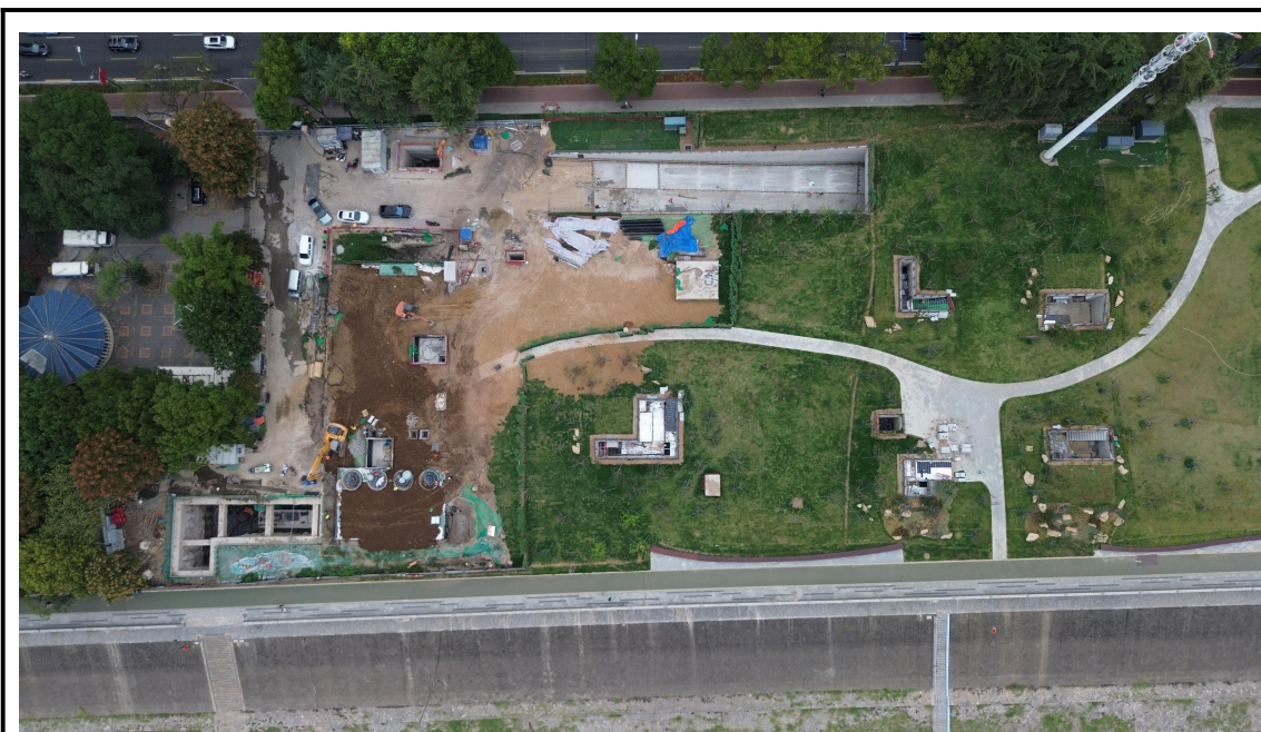
站场工程区（大公桥调蓄池）（2024年9月）