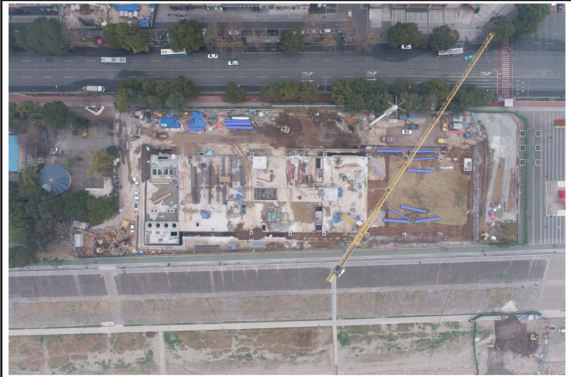
站场工程区（大公桥调蓄池）（2024年3月）