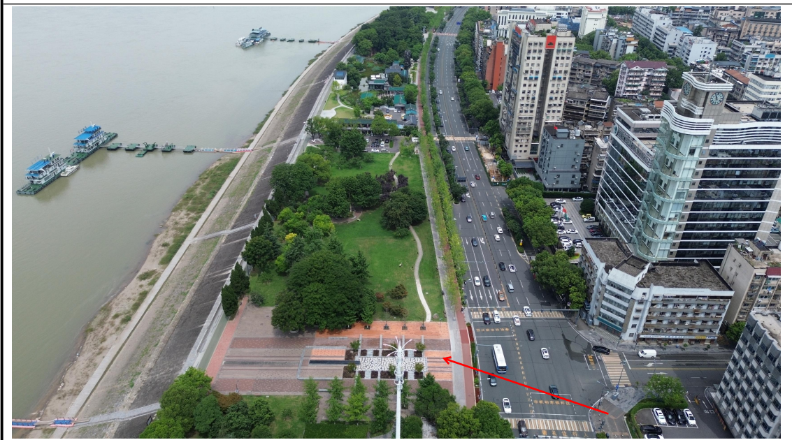
顶管作业区已恢复（2024年6月）