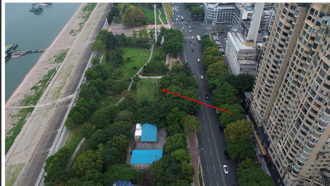
顶管作业区已恢复 (2024 年 9 月)