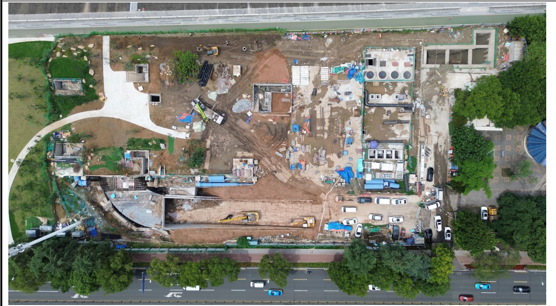
站场工程区（大公桥调蓄池）（2024年6月）