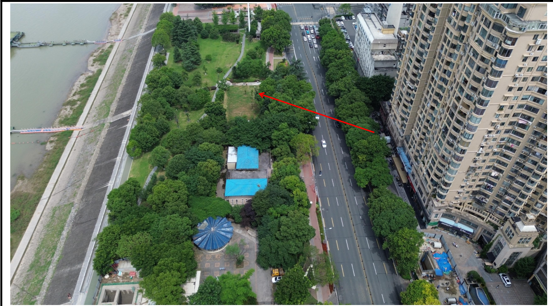
顶管作业区已恢复 (2024 年 6 月)