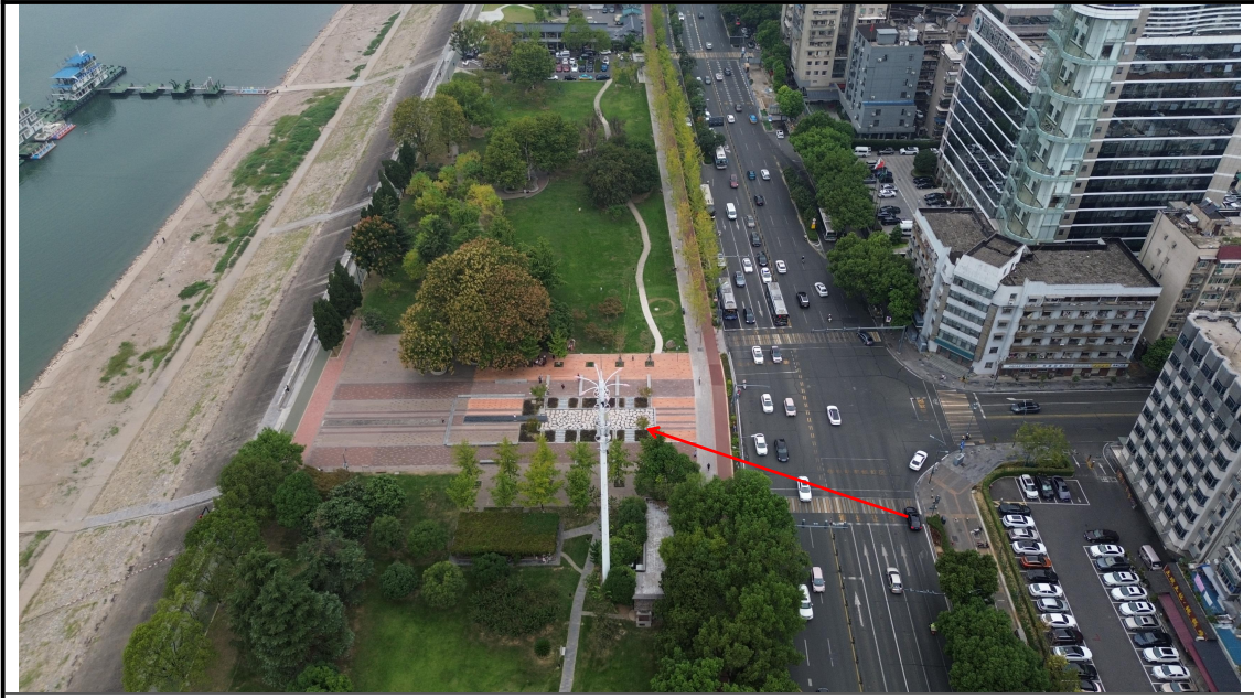
顶管作业区已恢复（2024年9月）