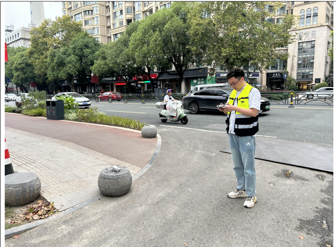
水土保持现场监测

(3) 根据收集整理的水土保持相关资料与建设单位、监理单位、施工单位进行对接，针对现场问题进行协商处理。