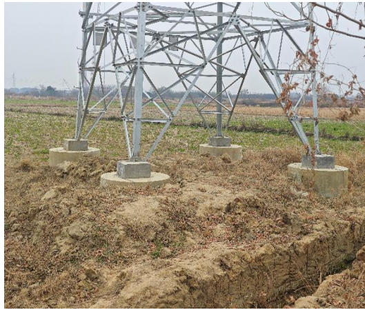
集电线路需完善土地整治措施