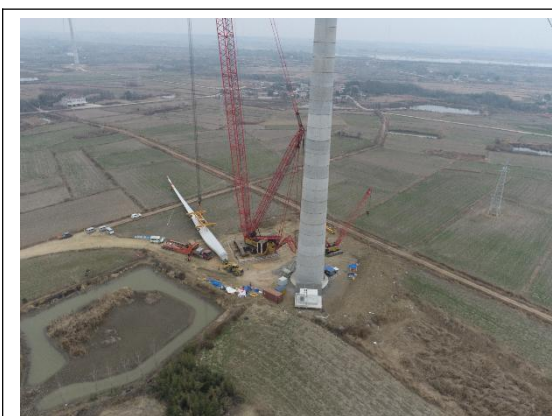
Z09 风机吊装平台 (2024.12.25)