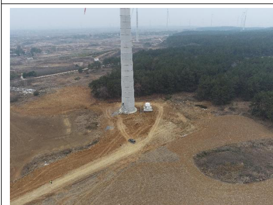
Z05 风机吊装平台 (2024.12.25)