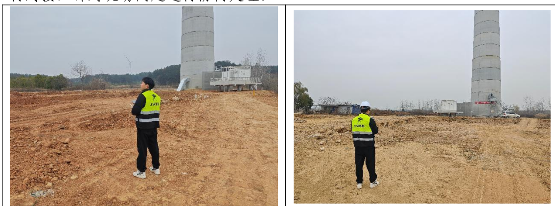
本期水土保持监测，无人机航拍

3、根据收集整理的水土保持相关资料与建设单位、监理单位、施工单位进行对接，针对现场问题进行协商处理。