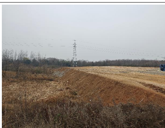
Z18 风机平台边坡整治 (2024.12.25)