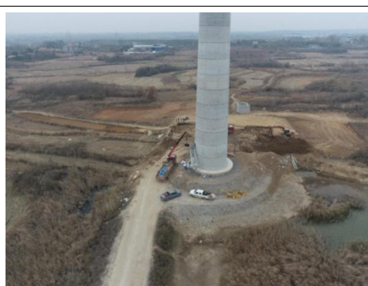
Z17 风机吊装平台 (2024.12.25)