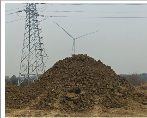
Z10 临时堆土及时进行苫盖