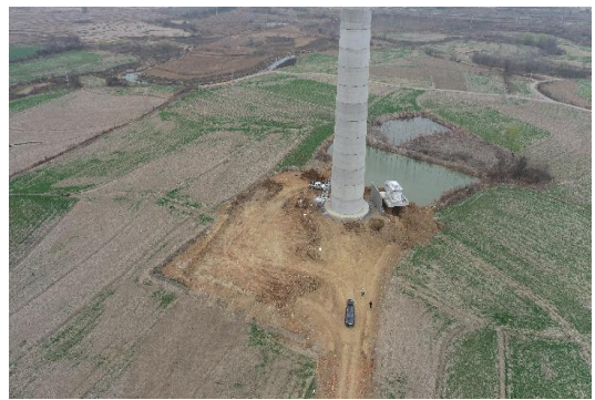
Z15 风机平台 (2025.3.11)