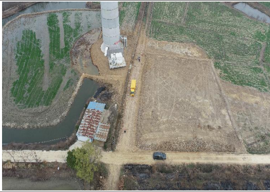
Z08 风机平台恢复情况 (2025.3.11)