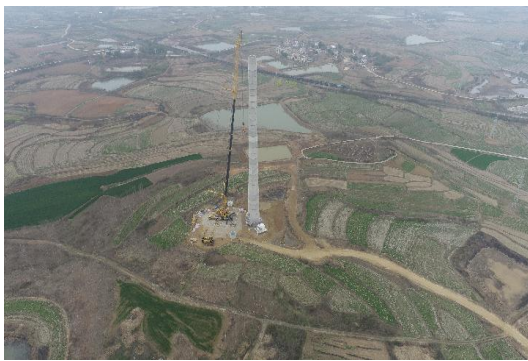
Z15 风机吊装平台 (2025.3.11)