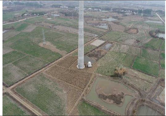
Z09 风机平台恢复情况 (2025.3.11)