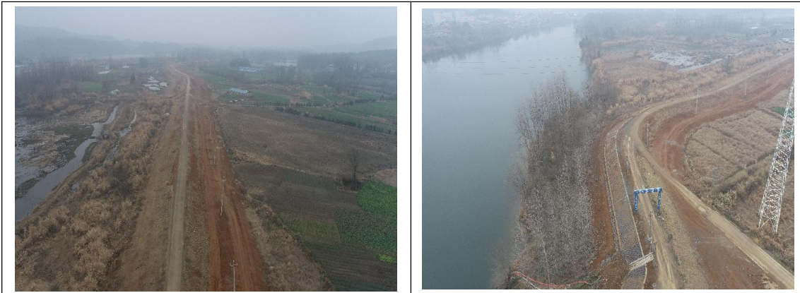
四 5+200~四 6+000 段