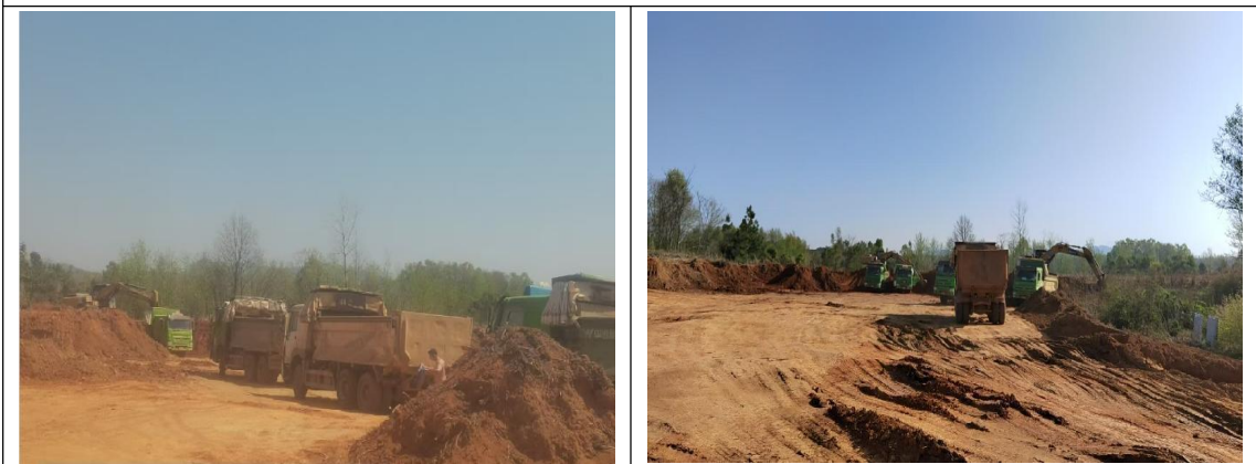
盘石村取土场土方开挖运输