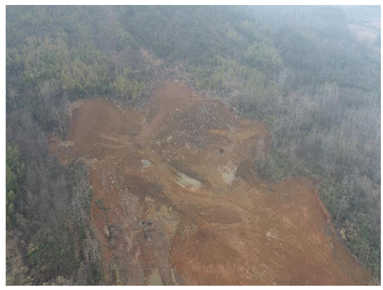
四清 2 号取土场