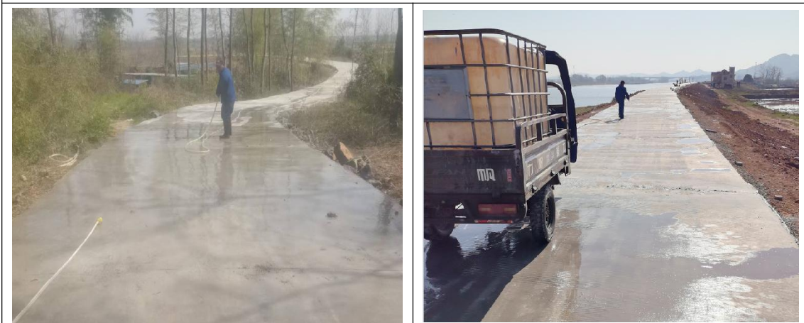
四清段堤顶道路养护